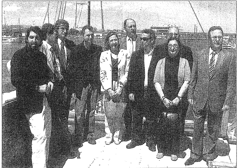
Personalidades del mundo empresarial valenciano apoyan la iniciativa del 0,7 para recursos hídricos en África. V. H.

El total que se pretende recaudar desde esta iniciativa soli-