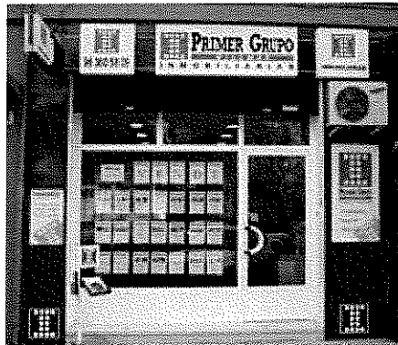
La compañía mantiene operativos más de 40 establecimientos en España

La cadena de franquicias que opera en el sector inmobiliario ha presentado esta mañana, aprovechando la celebración de su Convención Anual, las previsiones de cierre del presente ejercicio que reflejan una cifra de negocio que alcanzará los 44 millones de euros.