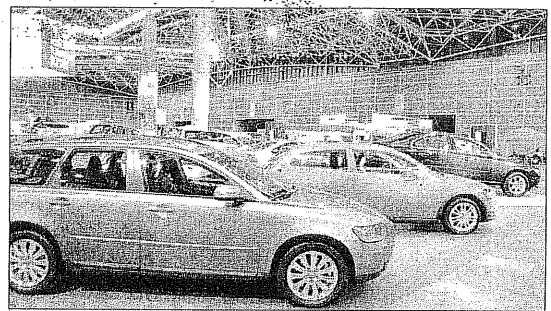
El problema automovilístico es un hecho a nivel mundial.