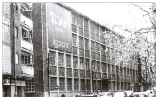
Llanera va a construir 74 viviendas protegidas en Benicalap

Otra de las zonas donde la firma tiene previsto construir pisos protegidos es el área de influencia de la ciudad de Valencia. En total son más de 130 las viviendas proyectadas. La primera promoción se construirá en Benicalap. Se trata de un edificio con 74 viviendas protegidas cuya inversión se cifra en algo más de 11 millones de euros. Silla es la segunda población donde existe un proyecto VPO, con un total de 58 unidades. La