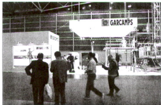
La firma estuvo presente en Laboralia con todos sus productos y servicios.